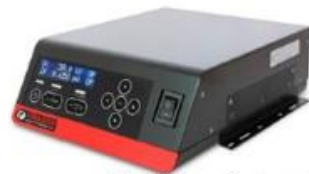
Posición estándar sobre mesa o puesto de trabajo con soportes a los lados