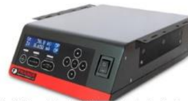
Posición debajo del puesto de trabajo sostenido por soportes laterales